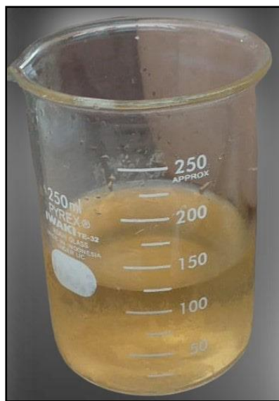
Gambar 1. HPI cair yang dihasilkan dari filtrasi bertahap

Penentuan kondisi optimum pada proses hidrolisis tersebut mengacu pada penelitian yang dilakukan oleh Zilda et al. , (2021) yang dimodifikasi, yaitu enzim protease dapat menghasilkan produk HPI dengan kandungan protein yang relatif lebih tinggi apabila menggunakan B.licheniformis pada suhu 55°C selama 6 jam. Perbandingan volume air terhadap berat daging ikan mempengaruhi rendemen protein yang dihasilkan dan tingkat pemecahan protein oleh enzim menjadi optimal (Petrova et al. , 2018). Proses mikro dan ultrafiltrasi secara bertahap dapat mengisolasi dan memperkaya fraksi peptida dengan berat molekul (BM) berukuran 1 - 4 kDa, sehingga meningkatkan pula sifat fungsionalnya (Suwal et al. , 2018).