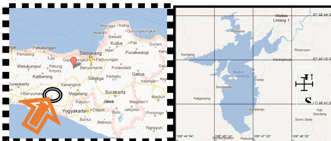
Gambar 1. Daerah lokasi penelitian waduk Wadaslintang, Jawa Tengah. Figur 1. Wadaslintang reservoir research sites, Central Java.

Penelitian ini dilakukan di waduk Wadaslintang, Jawa Tengah (Gambar 1), pada bulan April, Juni, September dan Nopember 2013. Pengumpulan data dilakukan dengan menggunakan metode survei lapangan dan laboratorium. Nelayan yang dipilih untuk mengoperasikan jaring adalah nelayan yang sudah berpengalaman dalam menangkap ikan lebih dari 12 tahun, jumlah nelayan yang mengoperasikan jaring sebanyak tiga orang. Contoh ikan diperoleh dari hasil tangkapan nelayan menggunakan jaring insang, dengan ukuran mata jaring mulai dari 0,75 – 4,5 inchi sebanyak masing-masing tiga pcs per ukuran per nelayan. Operasional jaring dilakukan di tepi waduk dengan posisi melintang pada kedalaman berkisar antara 2-5 meter. Masing-masing jenis ikan hasil tangkapan di catat beratnya (biomasa), jenis ikan diidentifikasi menggunakan buku Kottelat et al. (1993), lalu diukur panjang dan bobotnya, diambil isi perutnya dimasukkan dalam kantong plastik kemudian diawetkan dengan larutan formalin 4 % dan diberi label. Pengamatan isi usus dilakukan di laboratorium biologi Balai Penelitian Perikanan Perairan Umum, Palembang. Jenis ikan makanan diidentifikasi menggunakan buku identifikasi dari Edmonson (1973), Needham & Needham (1963).