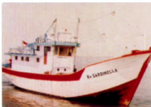
Gambar 2. KR. Sardinella.