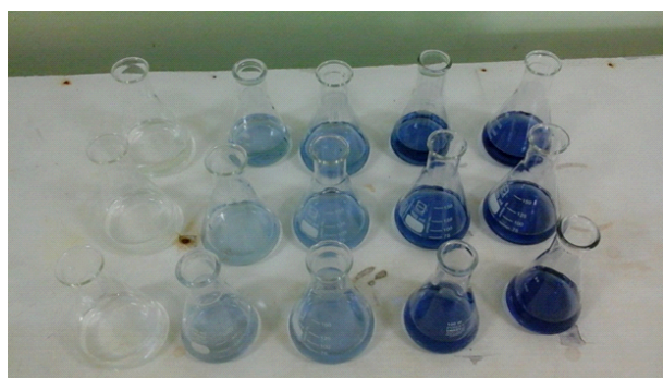
Gambar 1. Larutan deret standar fosfat dari konsentrasi rendah ke tinggi (kiri ke kanan)

Hasil penelitian menunjukkan nilai batas deteksi metode sebesar 0,003 mg/L. Konsentrasi fosfat dibawah 0,003 mg/L tidak dapat dideteksi dengan metode ini. Penentuan LOQ dilakukan dengan cara coba-coba pada larutan dengan konsentrasi fosfat 0,005 mg/L (konsentrasi blanko rata-rata + 5 S). Pada konsentrasi tersebut masih didapatkan nilai fosfat yang terkuantitasi sehingga tidak perlu dilakukan pada