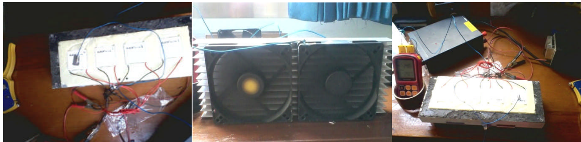
Gambar 4. Uji Coba Kinerja Elemen Peltier TEC1-12706