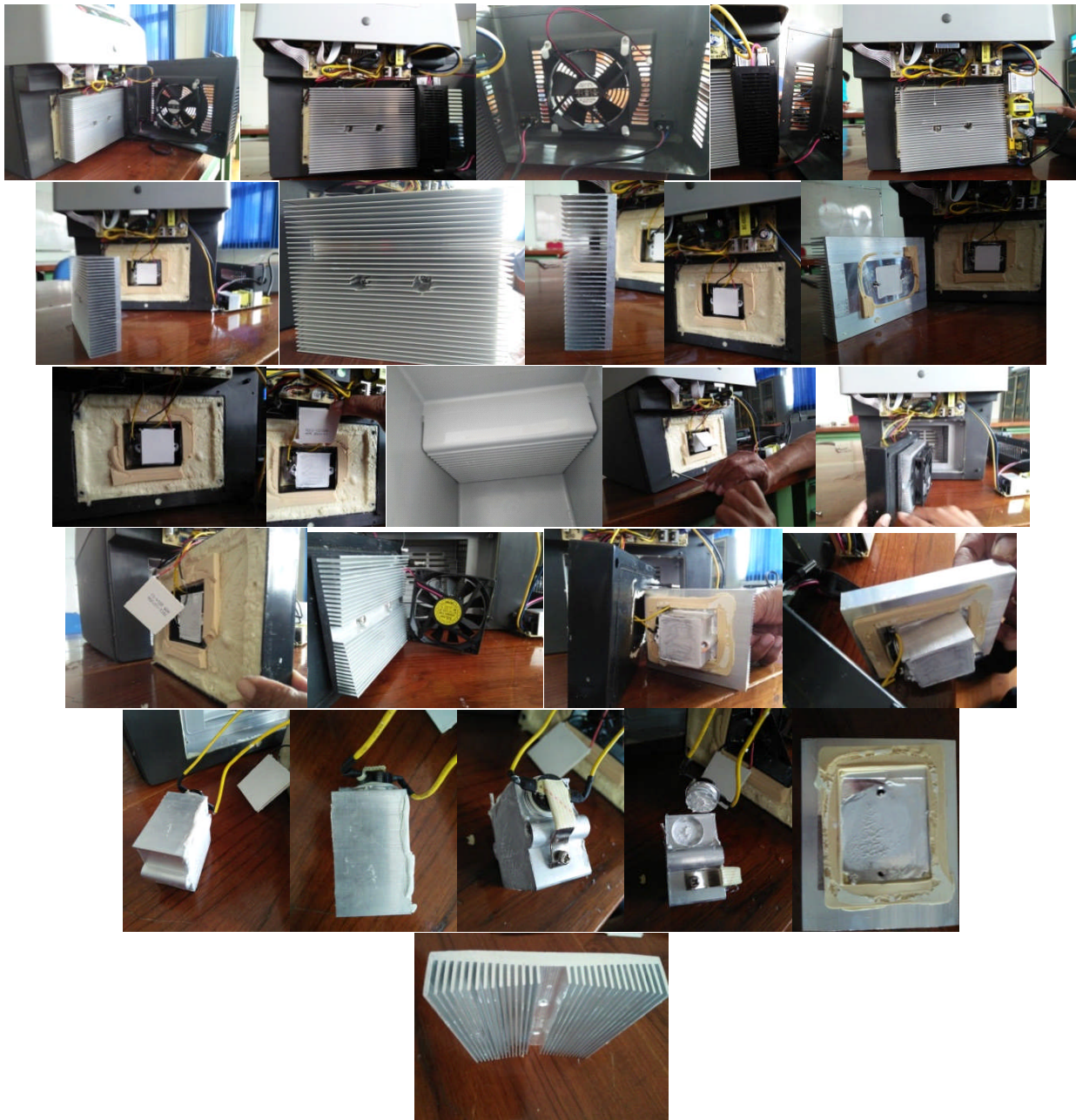
Gambar 1. Bedah Kotak Penyimpanan Berpendingin TEC