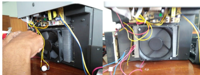
Gambar 3. Uji Coba Kinerja Tropicool TC 14FL Dengan Modifikasi Komponen