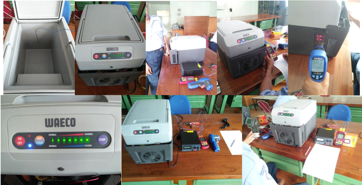
Gambar 2. Uji Coba Kinerja Tropicool TC 14FL