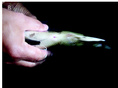
Gambar 2. Kateterisasi untuk melihat adanya telur pada induk betina (A); pengurutan ( stripping ) untuk melihat ada tidaknya sperma (B)