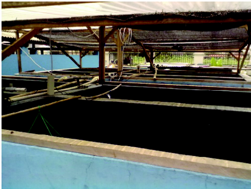
Gambar 1. Bak pemeliharaan calon induk

Sampling dilakukan 3 bulan sekali, yaitu pada bulan April, Juli, dan Oktober 2011 dengan parameter kematangan gonadnya. Pada induk