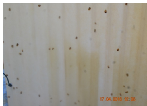
Gambar 4. Pertumbuhan awal