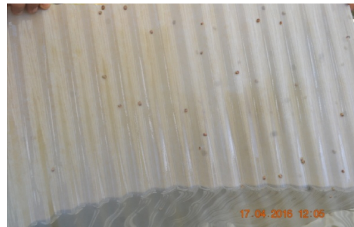
Gambar 3. Larva abalon