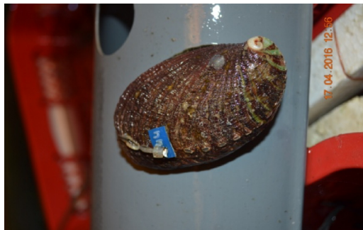
Gambar 2. Induk abalon