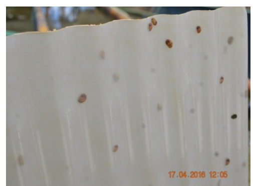
Gambar 5. Akhir pengamatan