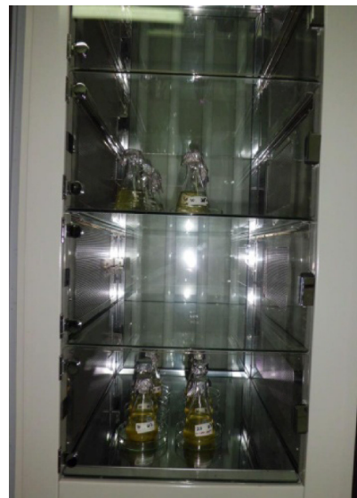
Gambar 2. Penetapan suhu pemeliharaan rotifer menggunakan Multi Thermo Incubator

rotifer pada akhir kegiatan menunjukkan perbedaan di antara ketiga perlakuan.