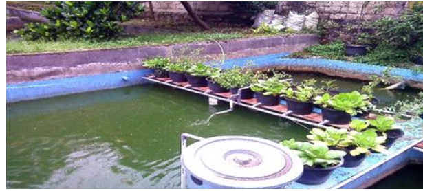
Gambar 1. Kolam budidaya dengan tanaman Yumina (pakcoy)

dan pukul 17.00 WIB. Pemberian pakan dilakukan secara restricted dengan FR 3%.