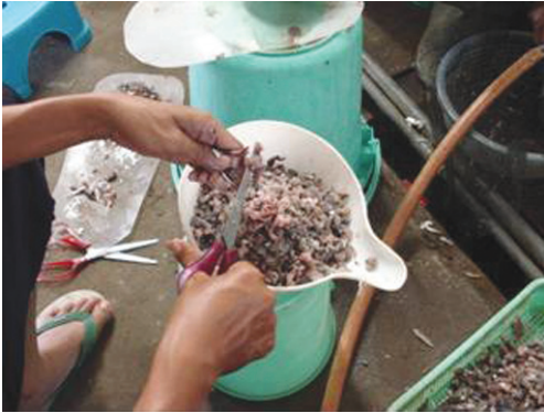
Gambar 5. Penyiapan pakan ikan rucah yang dicincang halus untuk benih ikan kerapu sunu dari umur 60—90 hari