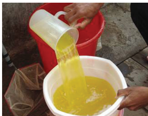
Gambar 3. Penyiapan pakan alami rotifera untuk larva ikan kerapu sunu

dengan petunjuk seperti Hatching Rate dan cara penetasannya, sehingga sangat mudah untuk disiapkan.