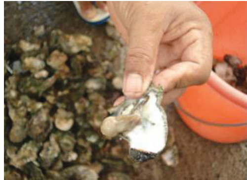
Gambar 2. Penyiapan pakan untuk larva dari gonad tiram

dengan plankton net untuk mendapatkan gonad tiram yang bersih dan siap diberikan ke larva. Gonad tiram diberikan mulai larva berumur 2 hari (D-2) sampai 9 hari (D-9) dengan frekuensi 2 kali sehari pada pagi dan sore hari.