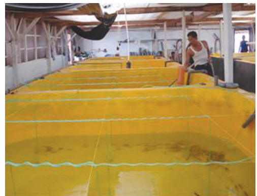
Gambar 1. Bak pemeliharaan larva ikan kerapu sunu

Pemeliharaan larva ikan kerapu sunu dilakukan mulai dari penebaran telur pada bulan Maret 2006 sampai dengan Juli 2006. Bak yang digunakan sebanyak 4 buah yaitu: bak 1 (Lv-1), bak 2 (Lv-2), bak 3 (Lv-3), dan bak 4 (Lv-4) yang dindingnya dicat berwarna kuning, masing-masing bak berkapasitas 10 m 3