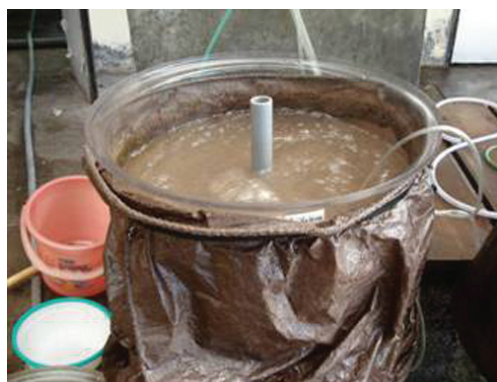
Gambar 4. Penyiapan pakan alami artemia untuk larva ikan kerapu sunu

dengan petunjuk seperti Hatching Rate dan cara penetasannya, sehingga sangat mudah untuk disiapkan.