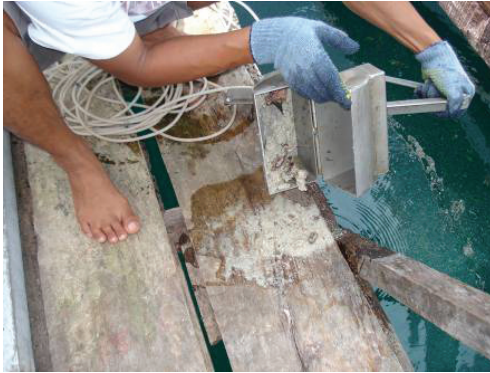
Gambar 2. Ekman grab untuk mengambil contoh sedimen

Kandungan bahan organik dihitung dengan rumus: