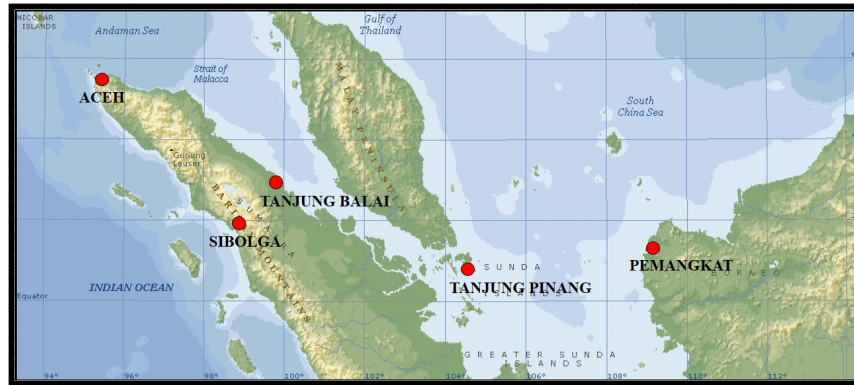
Gambar 2. Lokasi pengambilan sampel jaringan ikan banyar. Figure 2. Tissue sampling sites of Indian mackerel.

Masing-masing sampel (120 sampel) dianalisis dengan menggunakan metode analisis yang digunakan adalah RAPD ( Random Amplified Polymorphic DNA ) dengan menggunakan 4 (empat) pasang primer. Primer-primer yang digunakan adalah sebagai berikut: Rk1, Rk10, Rk12 dan Rk48. Proses ekstraksi dan purifikasi dilaksanakan melalui metode mini column dari PureLink™ Genomic DNA Kits, Invitrogen™. Proses amplifikasi dengan mesin PCR menggunakan mastermix KAPA2G Robust HotStart ReadyMix PCR Kit. Siklus pada proses amplifikasi disetting sebagai berikut: 1 siklus denaturasi pada suhu 95 °C selama 3 menit, 35 siklus penggandaan yang terdiri dari 95 °C selama 15 detik, suhu annealing selama 15 detik dan 72°C selama 15 detik; selanjutnya 1 siklus terakhir pada suhu 72 °C selama 10 menit. Suhu annealing untuk primer Rk 1 adalah 52°C, untuk primer Rk10 dan Rk 48 adalah 53°C dan untuk primer Rk12 adalah 58°C.