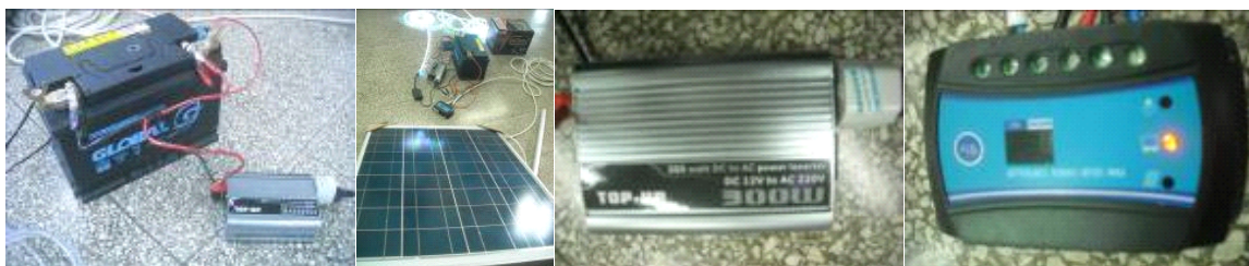
Gambar 4. Aki kering, solar cell, inverter dan battery charge regulator (BCR). Figure 4. Dry battery, solar cell, inverter and battery charge regulator (BCR).