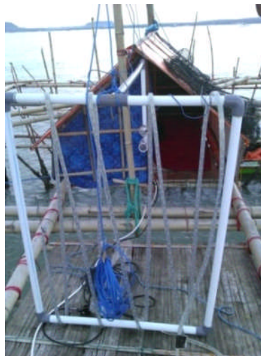
Gambar 3. Lampu LED yang dililitkan pada pipa paralon. Figure 3. The LEDs lamp rounded at the paralon pipe.

Adapun komponen photovoltaic (PV) adalah solar cell 100 WP, aki kering 95 Ah, inverter (pengubah arus DC menjadi AC), dan battery charge regulator (BCR) sebagai pengatur keluar masuknya aliran listrik dari solar cell ke aki seperti pada Gambar 4.