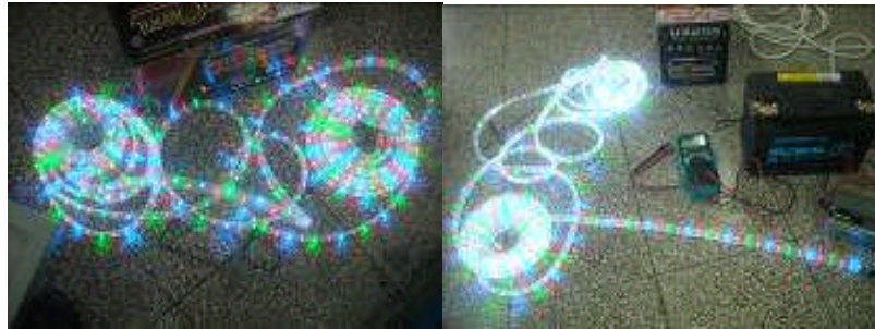
Gambar 2. Lampu LED selang yang digunakan ujicoba penangkapan. Figure 2. The LEDs lamp for experiment fishing.

Lampu LED berbentuk selang tersebut dililitkan pada pipa paralon yang sudah dibentuk segi empat sebanyak 5 x 2 lilitan (Gambar 3). Pada ujung lampu LED selang yang di rumah bagan dilengkapi dengan switcher untuk merubah warna nyala lampu LED.