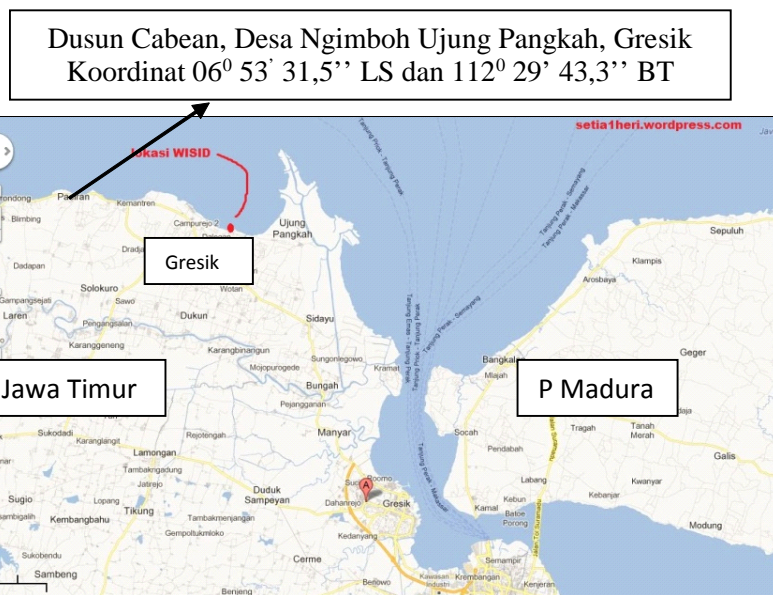
Gambar 1. Peta menunjukkan lokasi penelitian. Figure 1. The map showing research location.

Penelitian ini dilakukan di perairan Teluk Ngimboh, Dusun Cabean, Kecamatan Ujung Pangkah Kabupaten Gresik (Gambar 1). Waktu penelitian adalah pada saat bulan gelap (bulan mati) pada bulan Juli dan Agustus 2013, pada saat sedang berlangsung musim ikan di sekitar beroperasinya bagan tancap.