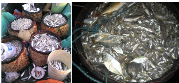
Gambar 6. Hasil tangkapan bagan di Gresik.