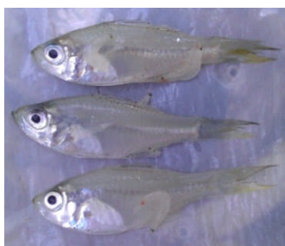
Gambar 7. Ikan pengkah ( Escualosa elongata ).