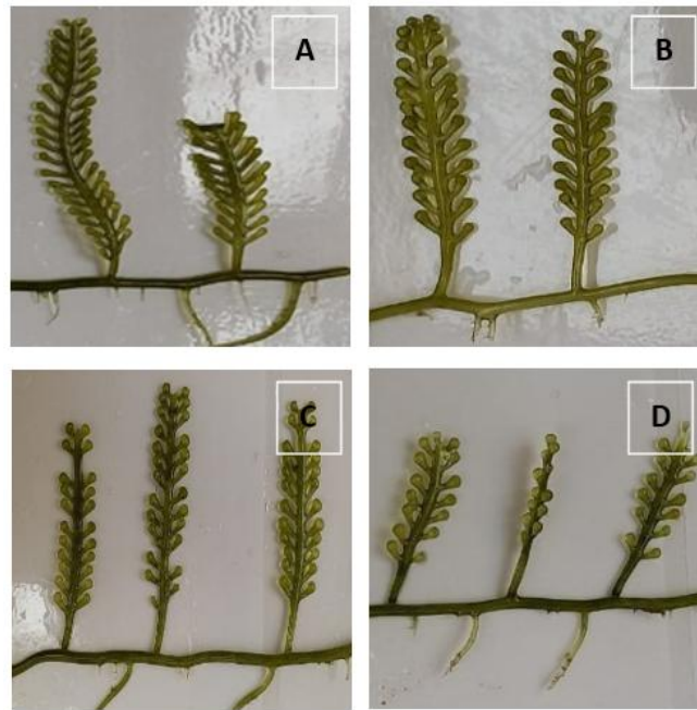
Gambar 1. Morfologi Caulerpa racemosa setelah 30 hari perendaman yang berbeda menggunakan zat pengatur tumbuh (ZPT) berbahan dasar jagung: (A) Perlakuan A, (B) Perlakuan B, (C) Perlakuan Caulerpa (D) Perlakuan D