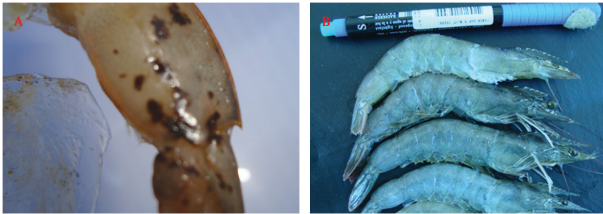
Gambar 2. Gejala infeksi TSV: melanisasi atau kromatofor dan nekrosis pada permukaan kulit (A) dan gejala IMNV: garis putih melintang pada bagian abdomen dan ekor yang merah (B)