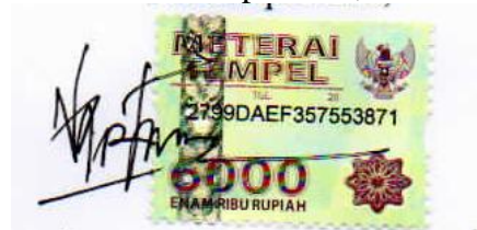
Otong Zenal Arifin