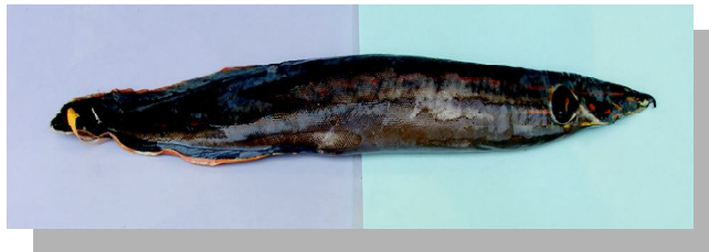
Gambar 1. Calon induk ikan tilan merah, 45 cm PT

Ikan tilan merah (Gambar 1), hidup di perairan yang tenang (demersal) air tawar dengan vegetasi yang lebat atau pada lumpur yang lunak di mana mereka menunggu mangsanya. Suhu air 24°C–32°C, pH 6–8. Makanannya berupa ikan atau serangga, cacing, kepiting rawa, dan bagian tanaman. Untuk kebutuhan penelitian maka ikan perlu domestikasi dengan pemeliharaan di luar habitatnya seperti yang dilakukan terhadap ikan balashark (Subandiyah et al. , 1995) serta pengamatan gonadnya. Satyani et al. (2002) telah berhasil melakukan pengamatan kematangan gonad dengan pemeliharaan di luar habitat terhadap ikan balashark, dan cara ini juga akan dikaji untuk ikan tilan merah.