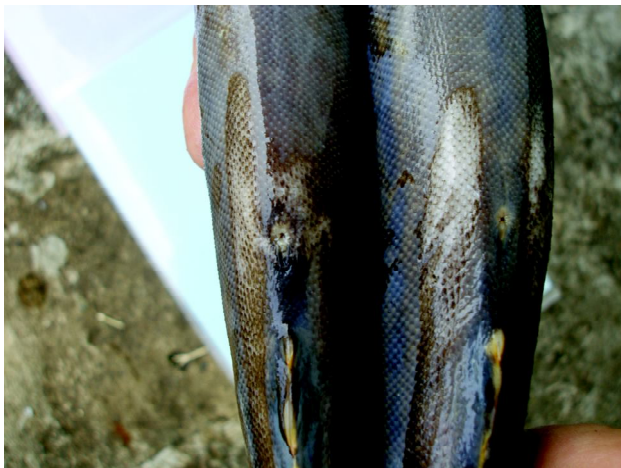
Gambar 5. Perbedaan jantan dan betina ikan tilan

Pengamatan kualitas air yang meliputi suhu, oksigen terlarut, pH, konduktivitas, alkalinitas, nitrat, nitrit menunjukkan hasil yang menunjang kehidupan ikan tilan