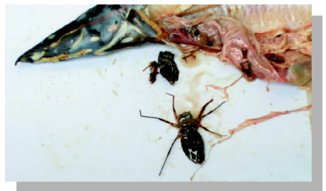
Gambar 2. Isi usus ikan tilan merah terdiri atas larva serangga capung dan serangga air lainnya

Dari pengamatan ini diharapkan akan mendapatkan calon induk yang terdomestikasi untuk pengembangbiakan lebih lanjut di dalam wadah terkontrol (hatcheri).