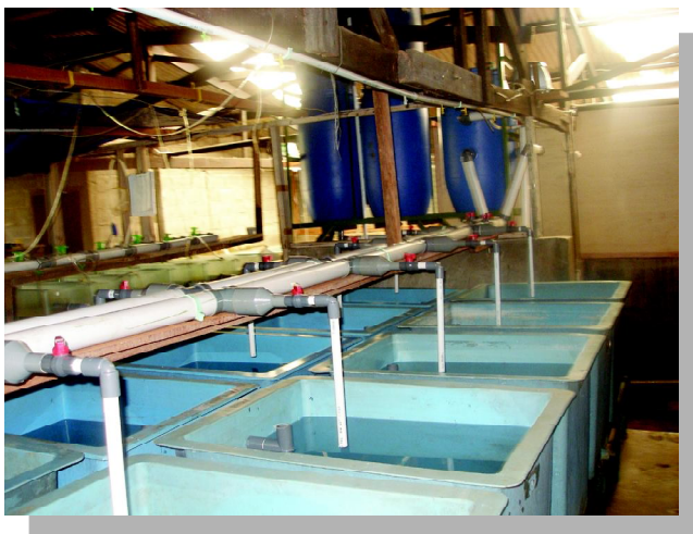
Gambar 3. Wadah pemeliharaan ikan tilan merah di dalam sistem resirkulasi tertutup

Domestikasi koleksi sampel hidup dipelihara di dalam 2 buah bak beton masing-masing diisi 75 ekor calon induk; ukuran bak 2 m x 2 m dengan kedalaman air 80 cm dipelihara selama 2 bulan untuk aklimatisasi serta pemberian pakan alami pada bak pertama dan pakan buatan Charoon Phokphand (pelet komersial/pakan udang dengan kadar protein ~ 40%) pada bak kedua. Selanjutnya dilakukan treatment di dalam bak fibre dengan volume 200 L, dengan 3 perlakuan dan 3 ulangan kepadatan 15 ekor/bak. Sebanyak 15 ekor sisa dipelihara untuk cadangan jika terjadi kematian. Treatment pakan dengan memberikan pakan dengan pakan alami berupa cacing tanah 100%, pelet udang 100% (kadar protein 40%), dan campuran 50% cacing tanah dan 50% pelet udang; sebesar 5% bobot total ikan. Kematangan gonad diamati secara kualitatif dengan mengamati perkembangan badan induk jantan dan betina setiap bulan.