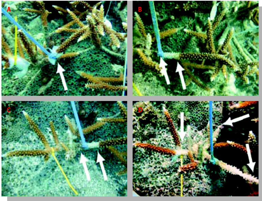
Gambar 3. Perkembangan penyakit karang White Band Disease Type II yang diinokulasikan pada karang A. cervicornis . A) hari 0; b) hari 2; c) hari 7; dan d) hari 17. Panah menunjukkan batas perkembangan penyakit

yang terinfeksi resisten atau memiliki positif efek dari pertumbuhan patogen atau virus.