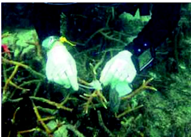
Gambar 2. Penelitian inokulasi bakteri penyebab penyakit pada karang bercabang Acropora cervicornis

Hasil penelitian pada bagian timur laut Mediterranean, karang jenis Oculina patagonica sebelum terinfeksi oleh Vibrio shiloi diawali dengan peristiwa bleaching di mana temperatur perairan mendekati maksimum 29°C-30°C.