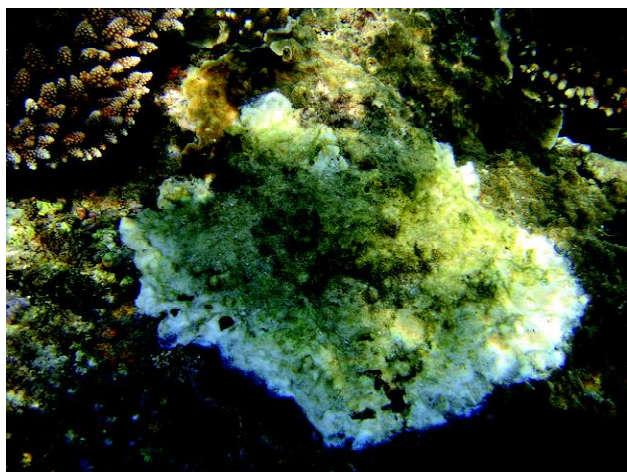
Gambar 5. Karang Montipora sp. bentuk life form folioux terserang oleh penyakit black band disease (BBD) di Pulau Pari, Kepulauan Seribu

Pada Gambar 5 terlihat jenis karang Montipora sp. terserang oleh penyakit BBD, pada kasus ini bagian yang diserang dimulai dari tengah koloni kemudian menyebar merata ke semua bagian koloni, terlihat bagian putih adalah bagian koloni yang baru saja mati, bagian yang putih beralga adalah bekas serangan yang agak lebih lama (4-7 hari) dan sedangkan bagian pinggir yang berwarna