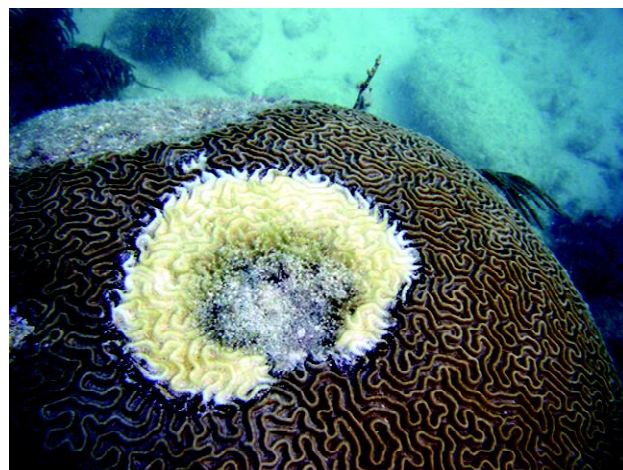
Gambar 6. Penyakit karang black band disease menyerang karang kelompok massive di Florida

Berbeda dengan pengalaman penulis selama mengikuti kursus Coral disease and others marine organisme di Florida, sebagian besar BBD menyerang karang dari kelompok massive seperti terlihat pada Gambar 6.