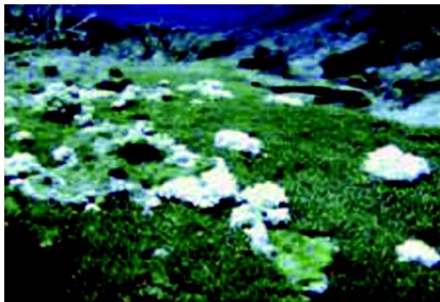
Gambar 4. Ditemukan tumor pada Acropora sp. jenis Tabulate (karang meja) di Pulau Kerama-Okinawa

akan mengalami tingkat reproduksi (oogenesis) yang menurun karena untuk proses oogenesis karang membutuhkan lemak dalam jumlah yang sangat besar. Dengan demikian juga semakin meningkatnya kepekaan tumor terhadap suhu air yang tinggi akan lebih dekat dengan semakin rendahnya kemampuan karang untuk menyimpan lemak sebagai cadangan energi di dalam tubuhnya, di mana lemak sangat dibutuhkan dalam proses metabolisme dan energi tambahan disaat stres.