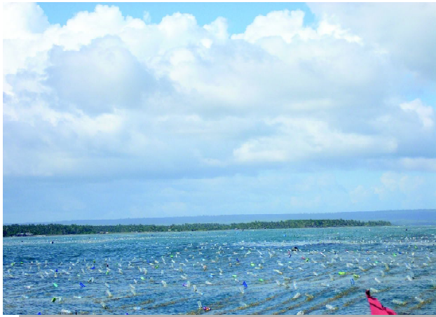
Gambar 3. Lokasi budidaya Eucheuma sp. di Kabupaten Bulukumba