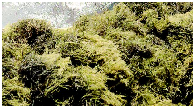
Gambar 2. Gracilaria sp. basah hasil panen di Kabupaten Luwu

Produksi Gracilaria sp. basah yang dicapai dengan metode budidaya tersebut adalah sekitar 7-12 ton/ha/siklus (Gambar 2) atau setara dengan 700-1.200 kg Gracilaria sp. kering, sedang produksi ikan bandeng dan windu sekitar 400-600 kg/ha/siklus dan 300-300 kg/ha/siklus jika selamat dari penyakit. Sedangkan produksi total rumput laut Gracilaria sp. yang dicapai di Sulawesi Selatan pada tahun 2006 dapat dilihat pada Tabel 1.