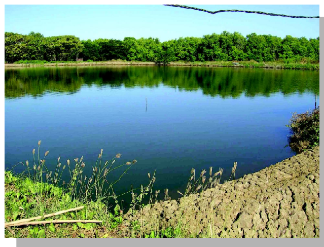
Gambar 1. Tambak budidaya Gracilaria sp. di Kabupaten Luwu

Belum meluasnya budidaya Gracilaria sp. di tambak, diduga karena masih adanya permasalahan atau kendala yang sering ditemukan di lapangan terutama yang berkaitan dengan jenis tambak di masing-masing daerah. Keberhasilan budidaya Gracilaria sp. di tambak sangat tergantung dari jenis tanah dasar dan sumber airnya. Menurut hasil penelitian, bahwa lahan tambak yang cocok untuk budidaya Gracilaria sp. adalah lahan pertambakan yang jenis tanahnya lempung berpasir dan lokasinya berbatasan dengan pantai sebagai sumber air (Gambar 1). Selain jenis tanah dasar tambak, jumlah, dan kualitas produksi Gracilaria sp. di tambak sangat ditentukan oleh kualitas bibit dan mutu air yang sesuai untuk pertumbuhan