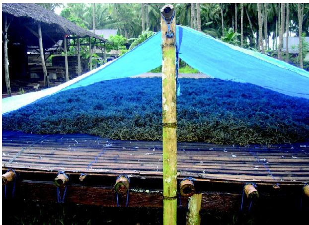
Gambar 5. Eucheuma sp. basah hasil panen di Kabupaten Bulukumba