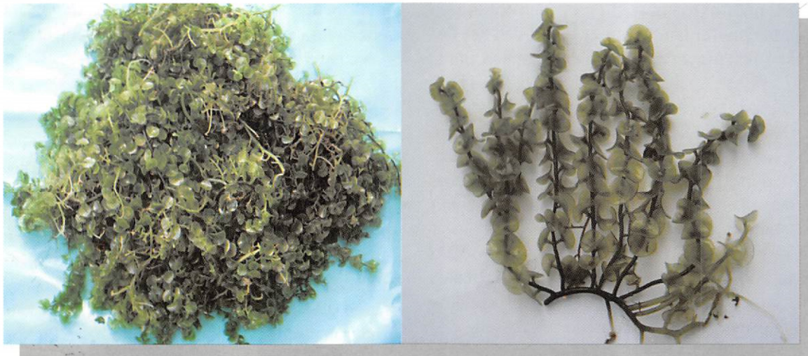
Gambar 3. Caulerpa sp. yang diambil di perairan Pantai Kuri Kabupaten Maros, Sulawesi Selatan

jamur. Studi awal dengan metode Kirby-Bauer untuk pengujian aktivitas antimikroba menunjukkan bahwa ekstrak Caulerpa racemosa var. Uvifera mampu menghambat pertumbuhan dua jenis bakteri yaitu Aeromonas hydrophila dan Edwardsiella tarda (Sengkey, 2000).