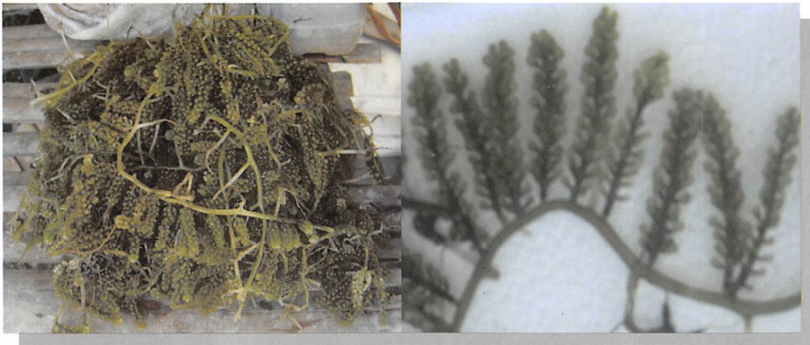
Gambar 2. Caulerpa lentillifera yang diambil dari hasil budi daya dalam tambak di Teluk Laikang Kabupaten Takalar, Sulawesi Selatan