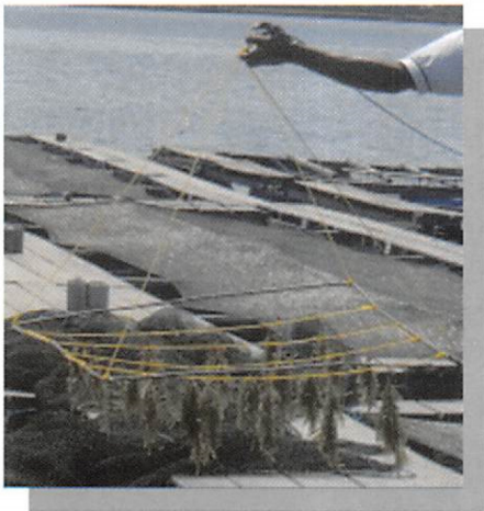
Gambar 5. Kurang produktif budi daya Caulerpa lentillifera pada tali di rakit apung

menemukan Caulerpa di pasar-pasar tradisional. Peluang dan tantangan untuk budi dayanya perlu dipikirkan terutama bila ada permintaan pasar yang banyak.