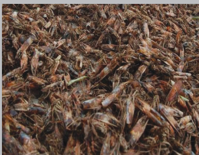
Gambar 5. Limbah kepala udang