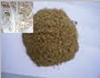
Gambar 2. Tepung bulu ayam