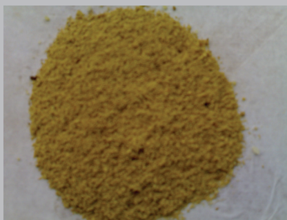
Gambar 4. Dedak