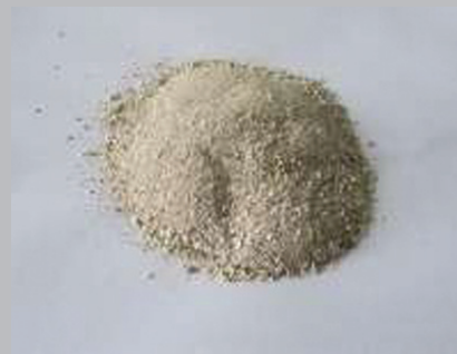
Gambar 3. Tepung tulang (Bone)