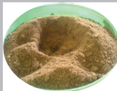
Gambar 6. Tepung bungkil inti sawit