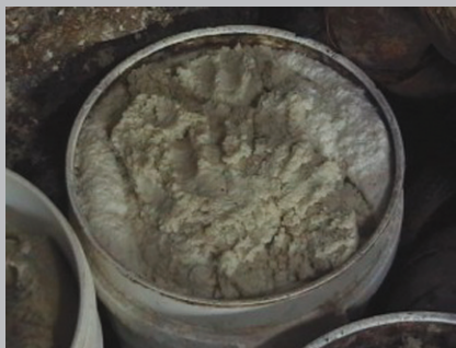
Gambar 1. Ampas tahu

Namun demikian, upaya pemanfaatan bahan baku pakan lokal tersebut masih mengalami kendala yaitu tingginya kandungan serat kasar, rendahnya kandungan protein kasar bahan baku, keseimbangan asam amino yang rendah dan adanya zat anti nutrisi. Sue (2004) menyatakan bahwa kandungan protein kasar bungkil inti sawit sekitar 11,30%-17,00% namun kandungan lemak dan serat kasar cukup