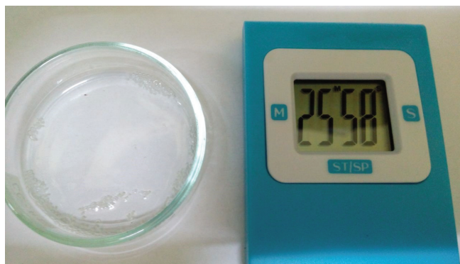
Gambar 2. Proses transfeksi selama 30 menit

Figure 2. Transfection process for 30 second