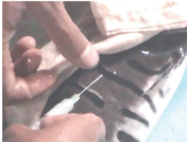
Gambar 2. Penyuntikan induk dengan menggunakan hormon gonadotropin