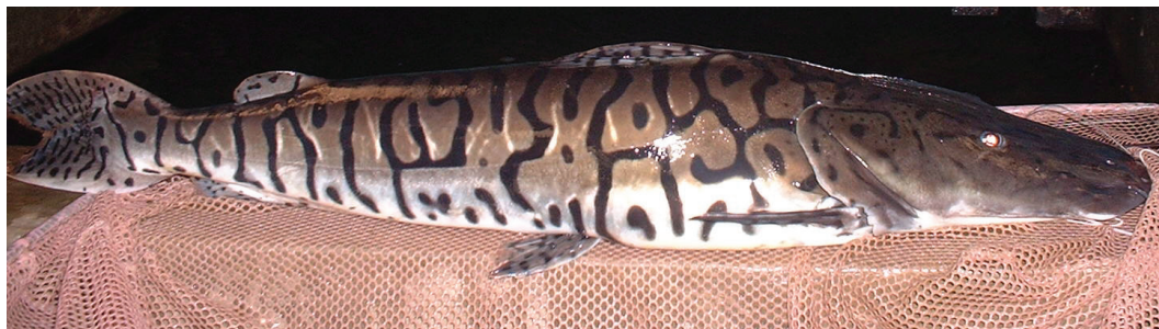
Gambar 1. Induk ikan hias Tiger Catfish ( Pseudoplatystoma fasciatum )