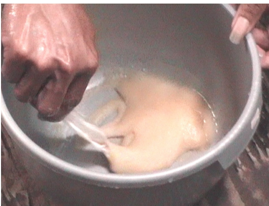
Gambar 5. Pembuahan/pengadukan telur dan sperma secara kering dan manual dengan bantuan bulu angsa Figure 5. Fertilization/mixing egg and sperm in a dry and manually with the help of goose feathers