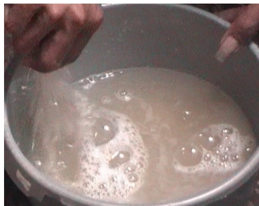
Gambar 6. Pencucian telur menggunakan air mineral Figure 6. Egg washing using mineral water

aerasi Masing-masing akuarium diisi air setinggi 20 cm yang berasal dari tandon. Jumlah telur yang dihasilkan setiap satu induk dapat mencapai 300.000 butir dengan daya tetas rata-rata 80% (Kusrini & Priyadi, 2013). Telur akan menetas semua dalam waktu 15-19 jam pada suhu berkisar antara 26°C-30°C. Larva yang telah menetas tetap dibiarkan dalam akuarium sampai kuning telur yang menempel di tubuh habis termakan. Sedangkan keragaan telur yang sedang diinkubasi dalam akuarium dan telur yang telah menetas (larva) dapat dilihat pada Gambar 7.