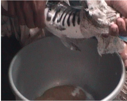
Gambar 3. Pengurutan telur pada induk betina Figure 3. Striping of eggs in the female brood