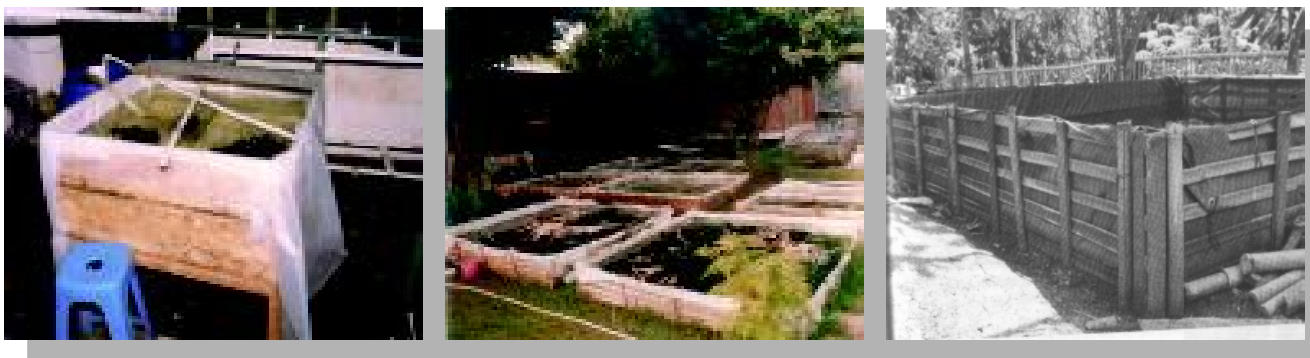
Gambar 5. Bak atau kolam-kolam dari plastik, rangka dapat terbuat dari kayu atau bambu

Keuntungan dari kolam-kolam dari plastik ini adalah harganya yang murah, pembuatannya mudah dan cepat, serta dapat langsung digunakan (Lingga & Susanto, 1986). Dibandingkan kolam dari semen yang mahal, butuh waktu lama dan tentu harganya juga mahal, serta menunggu waktu yang juga cukup lama untuk menggunakannya