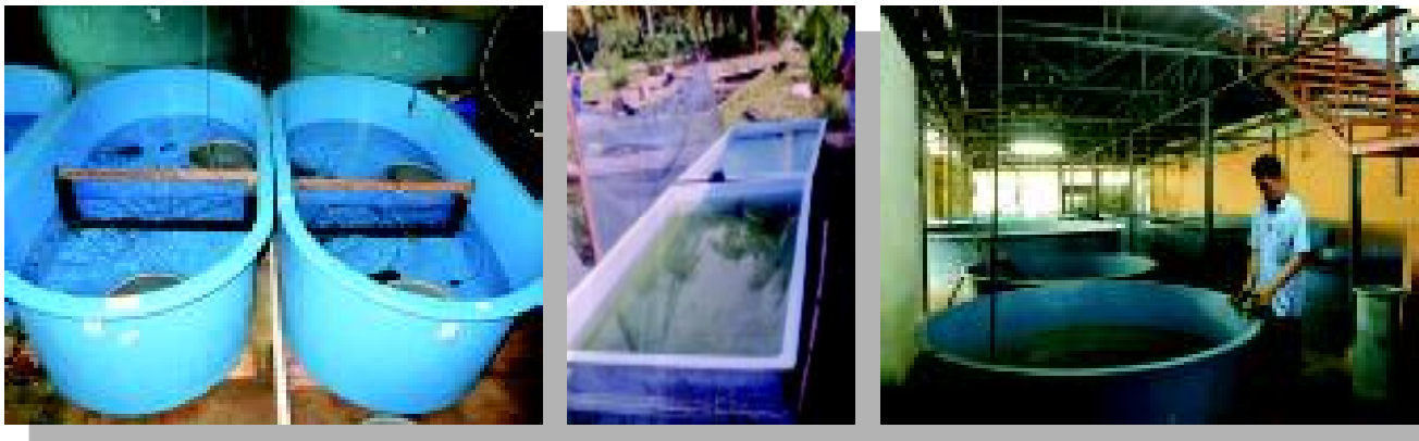
Gambar 2. Bak fiber glass yang banyak digunakan untuk wadah budidaya ikan hias, bentuknya dapat oval, persegi panjang, ataupun bulat

Bak atau wadah yang terbuat dari bahan fiber glass banyak digunakan dalam laboratorium-laboratorium penelitian dan para pengusaha/pedagang baik yang memiliki farming besar atau kecil. Bak dari bahan fiber