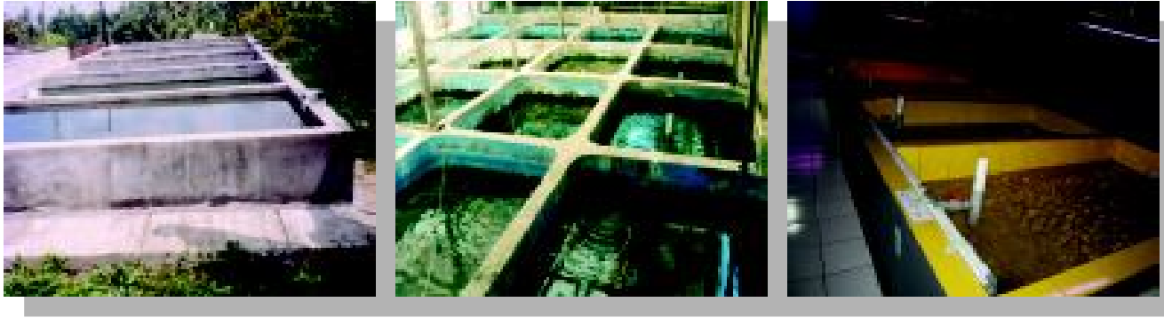
Gambar 4. Kolam/bak semen sangat umum untuk budidaya ikan hias. Bak dari keramik untuk pemeliharaan benih botia berwarna kuning agar warna ikan menjadi lebih bagus (kanan)

sering dipelihara dalam kolam semen. Untuk ikan ukuran kecil biasa digunakan pada pemijahan massal. Kekurangannya adalah bila bocor atau rembes kadang susah untuk dibetulkan atau diperbaiki. Kolam semen juga agak menunggu lama untuk dapat digunakan, karena menunggu air di dalamnya "hidup" yaitu sampai tidak ada efek New Tank Syndrome (sindrom bak baru) yang biasanya pada bak semen ini cukup lama. Kekurangan lain kolam semen yang umumnya dibuat di luar ruangan agak susah dikontrol suhunya dan mudah masuk hama larva capung yang membuat larva ikan banyak mati, terutama bila ada tanaman airnya.