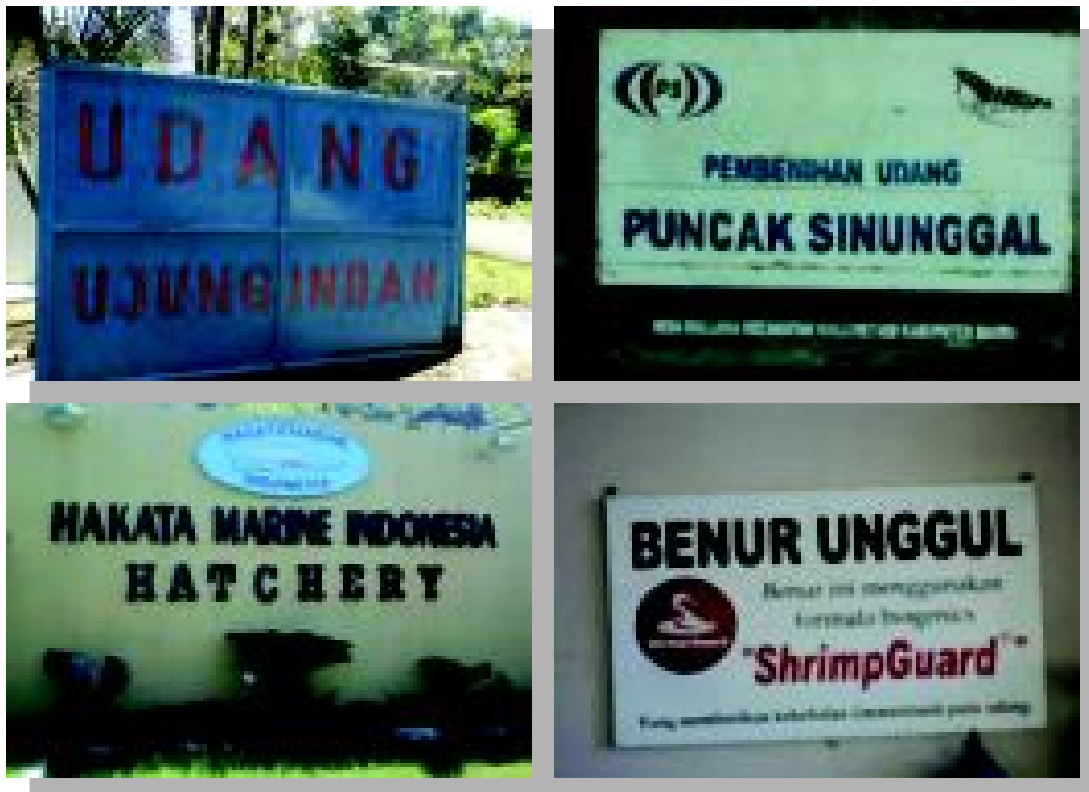
Gambar 4. Foto empat papan nama hatcheri dari 8 hatcheri yang dikunjungi di Kabupaten Barru

Hasil survai terhadap 15 responden yang terdiri atas pemilik hatcheri/teknisi (Hatcheri Saniri jaya, Kakakmarine, Benur kita, Dewiwindu, Mitra Sejahtera, Punak Sinunggal, BBAP Sido, Kencana, dan Hatcheri Supa