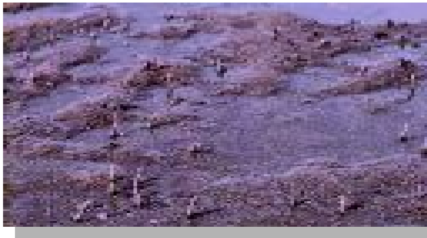
Gambar 3. Habitat cacing laut yang berada pada kawasan berlumpur di bawah tegakan mangrove

Selain daripada itu, masalah lain yang dihadapi pemilik hatcheri adalah rendahnya tingkat kematangan gonad udang serta kondisi cuaca (suhu) yang tidak menentu. Untuk mengatasi tingkat kematangan gonad yang tidak baik, para pemilik hatcheri memiliki teknik sendiri dalam mengatasi hal tersebut dengan cara memberikan pakan alami dengan protein tinggi yaitu cacing laut (Tabel 3).