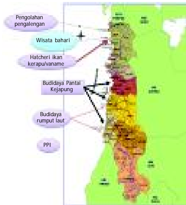
Gambar 1. Peta administrasi dan potensi pengembangan perikanan

Pada tahun 2005 potensial budidaya tambak di Kabupaten Barru seluas ± 3.500 ha dengan produksi 3.705 ton (Dinas Kelautan dan Perikanan Kabupaten Barru, 2005). Luas lahan yang optimal yang dimanfaatkan seluas ± 2.617 ha dengan pola budidaya intensif seluas ± 81,5 ha; semi-