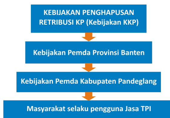
Gambar 1. Kerangka permasalahan retribusi nelayan

Kerangka permasalahan retribusi nelayan yang dibahas dalam tulisan ini merupakan kebijakan penghapusan retribusi bagi nelayan oleh Kementerian Kelautan dan Perikanan, merupakan kebijakan yang