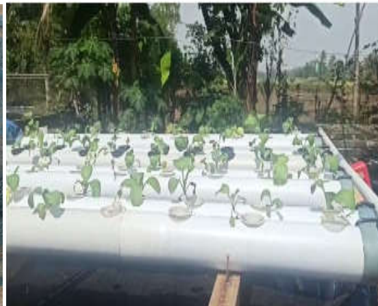
Gambar 3. Hasil Budi Daya Akuaponik.