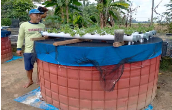
Gambar 2. Pilot Plant Akuaponik di Desa Toto Katon, Kabupaten Lampung Tengah.

yang terletak di Kecamatan Punggur, Kabupaten Lampung Tengah dengan mayoritas penduduknya bermata pencarian sebagai petani, buruh tani, dan pedagang. Pertanian di Toto Katon didominasi padi. Budi daya ikan air tawar di daerah Toto Katon dilakukan oleh beberapa pembudi daya ikan. Gambar 2 menunjukkan pilot plant akuaponik di Desa Toto Katon, Kecamatan Punggur, Kabupaten Lampung Tengah.