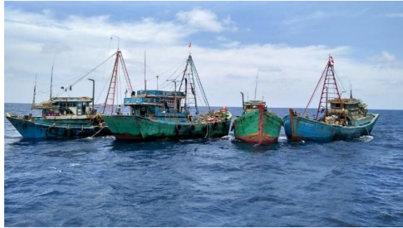
Gambar 1. Kapal illegal fishing , (Marmudah, 2019. p.45)