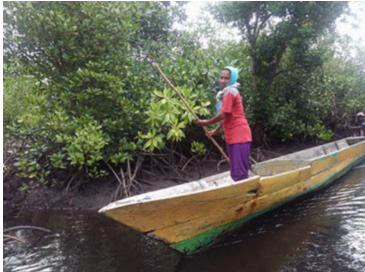
Gambar 4. Masyarakat setempat menggunakan alur-alur sungai di antara hutan mangrove sebagai jalur transportasi untuk mengangkut barang dan penumpang.

Figure 4. Local communities use river channels (creek) among mangrove forest patches as transportation network to transport passengers and goods.