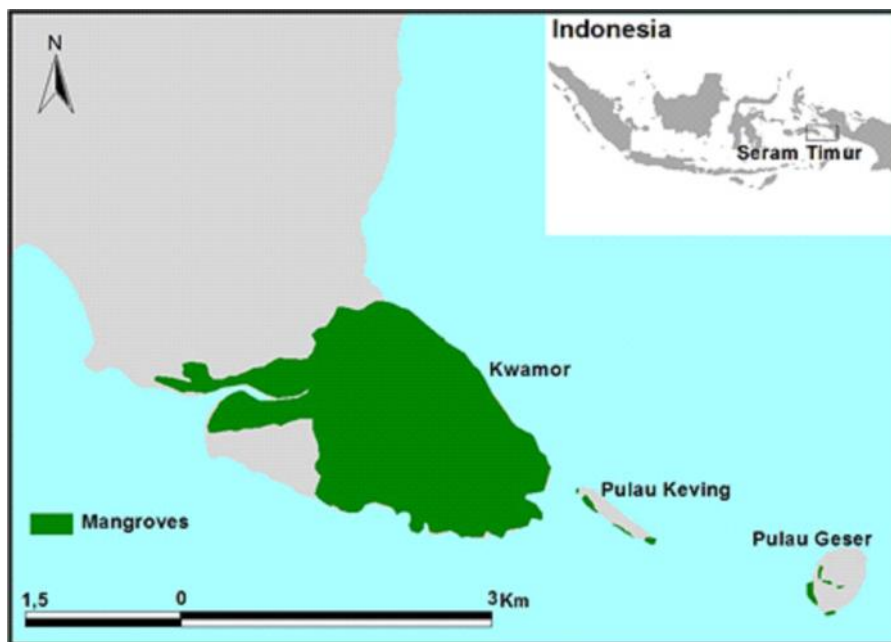
Gambar 2. Tutupan hutan mangrove di lokasi penelitian (Kwamor, Keffing, dan Pulau Geser), Seram Bagian Timur, Maluku, Indonesia.

(Suyadi, 2012; Suyadi, 2014). Sebaliknya, luas total hutan mangrove di Pulau Kwamor (> 2000km) jauh lebih luas yaitu hingga 3975 ha dan membentuk mangrove patches yang cukup luas, rata-rata (600 ha). Hutan mangrove di pulau-pulau berukuran besar (> 2.000km) seperti di Bintuni (Papua), Cilacap (Jawa), Weda (Halmahera), dan Batam (Sumatra) juga memiliki ukuran patches yang besar (Pramita, 2018; Suyadi, 2014; Irawan dan Malau, 2016).