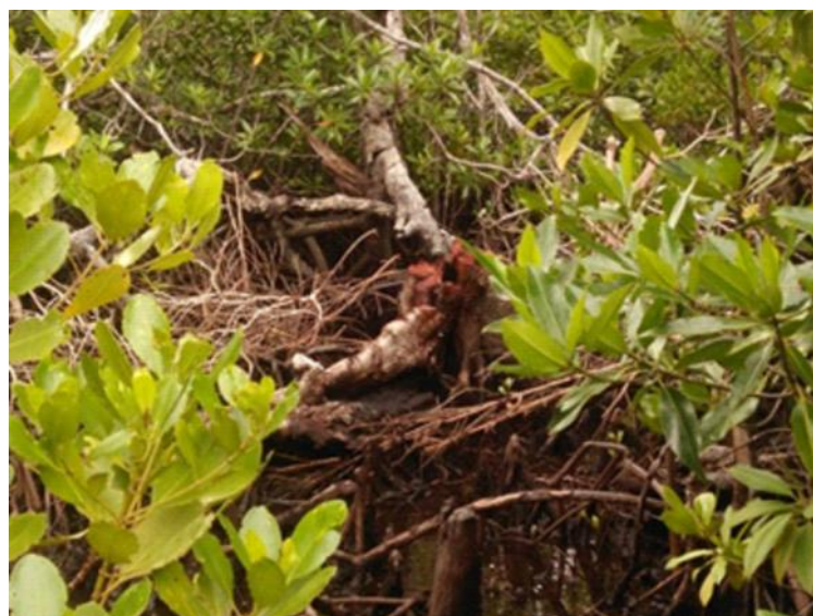
Gambar 3. Penebangan pohon mangrove yang dimanfaatkan masyarakat sebagai bahan bakar rumah tangga, industri rumahan ikan asap, dan di jual.