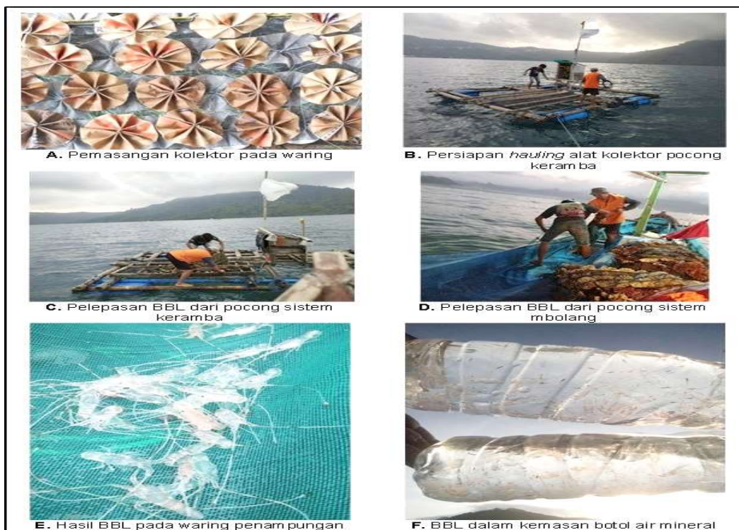
Gambar 1. Operasi penangkapan BBL di pesisir Prigi (Sumber: hasil survei 2022). Figure 1. Puerulus catching operation in Prigi coast (Source: survey results in 2022).

Cara kedua, pengoperasian alat kolektor pocong sistem perahu atau nelayan lokal menyebut 'Mbolang'. Alat kolektor pocong dibawa dan dioperasikan oleh perahu, sehingga bersifat mobile . Dalam pengoperasiannya dilakukan dengan cara one day fishing . Teknik penangkapan dilakukan dengan cara: nelayan berangkat dari fishing base pukul 17.00 WIB dan kembali pulang pukul 05.30 WIB. Perjalanan dari fishing base menuju fishing ground atau lokasi pemasangan alat kolektor pocong sekitar 1-2 jam dengan perahu motor. Setelah sampai di lokasi penangkapan, menyalakan lampu bawah air sambil menurunkan jaring. Kedalaman lampu celup LED (15 watt) sekitar 15 meter dari permukaan air laut. Jumlah alat kolektor pocong yang diturunkan sekitar 3-6 unit. Alat kolektor pocong direndam di laut sampai sekitar pukul 05.00 WIB, untuk selanjutnya dilakukan hauling . Setelah dilakukan menaikkan alat kolektor pocong ke atas geladak kapal, dilakukan pelepasan BBL dari kolektor untuk selanjutnya ditampung dalam wadah dan didaratkan. Proses pengoperasian alat kolektor pocong seperti disampaikan pada Gambar 1 (Sumber: hasil survei 2022).