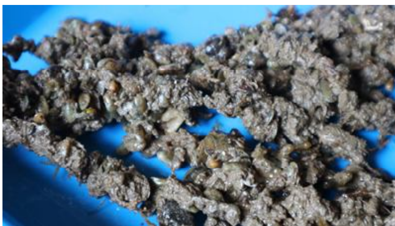
Gambar 2. Epifit dan substrat yang menempel pada Sargassum . Figure 2. Epiphytes and substrates attached to Sargassum .

lebih tinggi dibandingkan dengan kedalaman 30 cm dekat permukaan, hasil ini sama dengan pertumbuhan (Tabel 3). Hasil ini sama dengan penelitian sebelumnya yaitu kadar karagenan selalu berkorelasi positif dengan laju pertumbuhan, jika laju pertumbuhan tinggi selalu menghasilkan karagenan yang tinggi pula (Naguit et al. , 2009; Hurtado et al. , 2009). Tingginya kadar karagenan pada kedalaman 45 cm dan 60 cm disebabkan oleh intensitas cahaya yang masuk ke perairan optimal untuk pembentukan karagenan melalui proses fotosintesis. Hasil ini sama dengan penelitian sebelumnya yaitu kadar karagenan selalu berkorelasi positif dengan laju pertumbuhan, jika laju pertumbuhan tinggi selalu menghasilkan karagenan yang tinggi pula (Naguit et al. , 2009; Hurtado et al. , 2009).