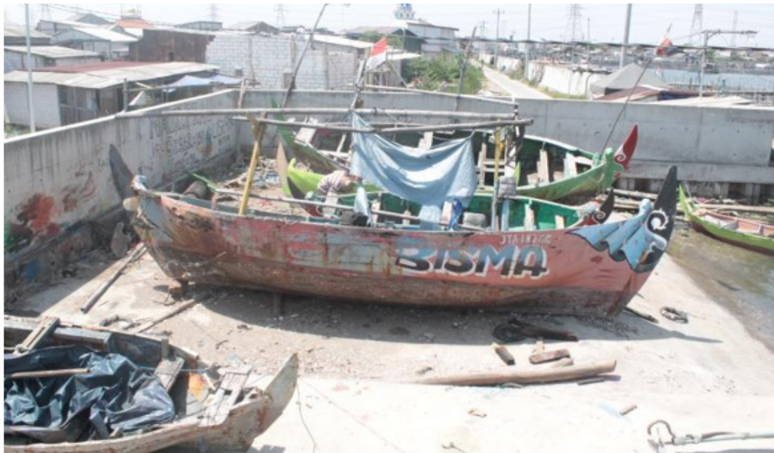
Gambar 1. Perahu Rusak, Nelayan Terpaksa Berhenti Melaut.