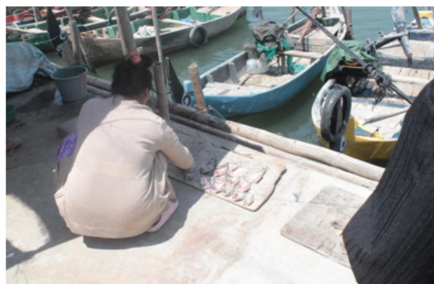
Gambar 2. Pengolahan Hasil Tangkap Oleh Istri Nelayan.